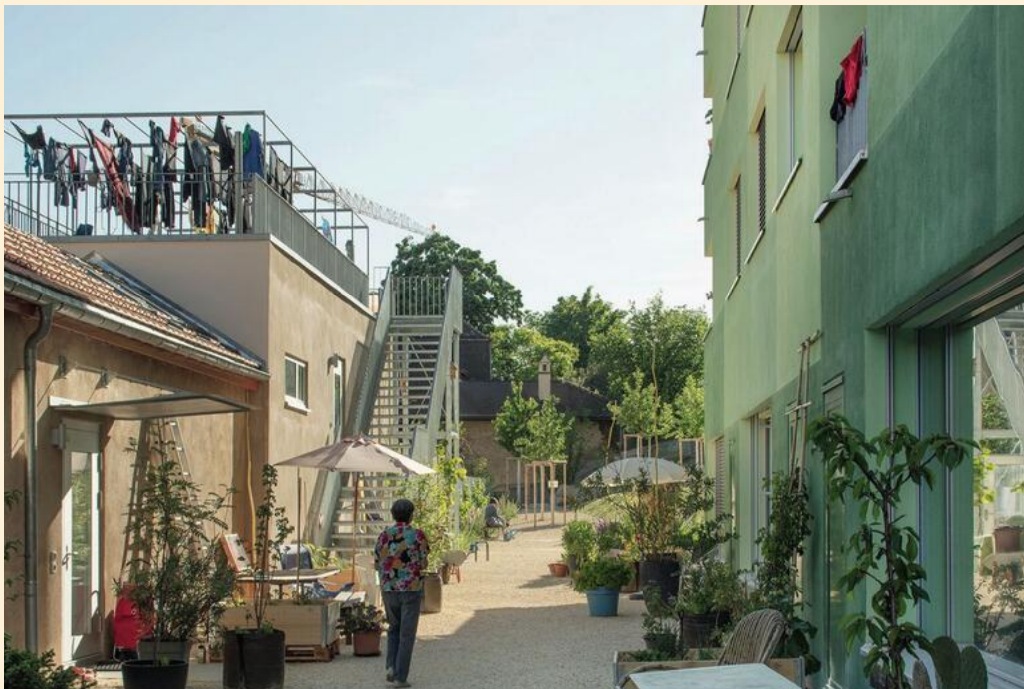
La coopérative d'en face, Neuchâtel, 2020